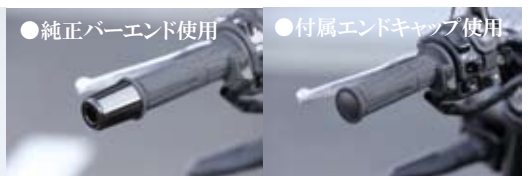
●純正バーエンド使用