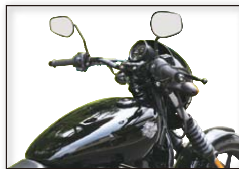
ロー&ナローバー装着例