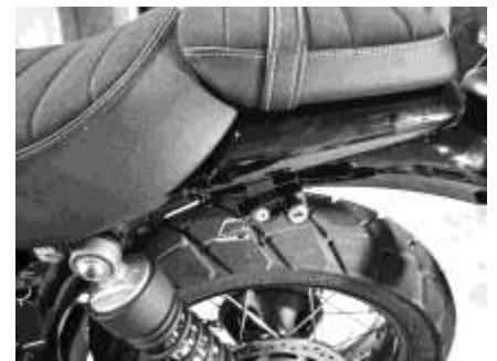
スクランブラー装着