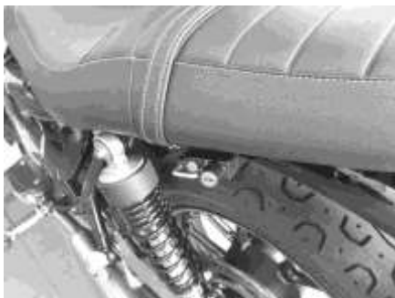
ストリートツイン装着