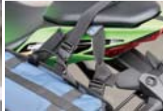
脱着はサイドリリースバックル なので安心楽々