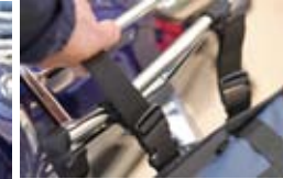
装着後の調整も可能