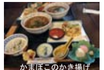
かまぼこのかき揚げ

天災が続き、心が落ち着かない日々が続きます。被害にあわれた地域の皆さんの日常が一日でも早く穏やかになることを祈っております。夏休みに温泉と考えておりましたが、諸事情があり中止に。その代わりに近場で楽しむことを考えました。箱根駅伝でも出てくる小田原中継所、鈴鹿かまぼこのかまぼこの里に行ってきました。前日に墓参りに福島も行きましたが、近場で楽しむのも良いですね。帰りのことを考えなくてよい距離って気持ちが良いですね。車ですけど休み明け、1週間ぶりにバイクのエンジン始動! 何か変な感じがする? 走り始めて20分ほど、信号が変わり前の車について行こうとすると... ストール。エンジン始動、アイドリングが不安定だ。そしてストール。その日は騙し、騙し何とか帰宅。さあ、どうする...。 KKK