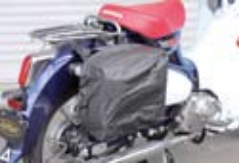
急な雨でも安心の レインカバー付属