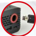
QUICKコネクト ホースの組立でも簡単差し込んで捻るだけ!