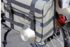
ウェビングの使用 (走行時は脱着防止対策を行って下さい。)