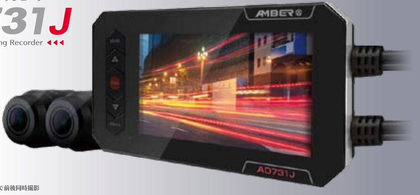
独立型高解像度デュアルカメラで前後同時撮影