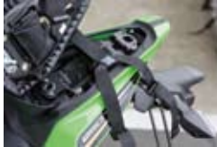
付属のY字ベルトをタンデム シートへ巻き付ける装着方法