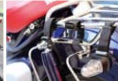
ループベルトの固定でキャリア、 フレームに吊り下げも可能